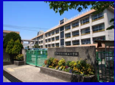
小学校徒歩4分 中学校徒歩7分