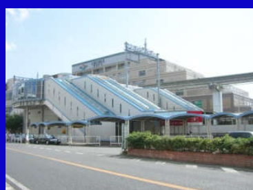
阪急宝塚線『蛸池』駅徒歩7分 大阪モレール『蛸池』駅徒歩7分