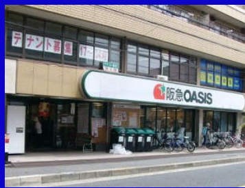
阪急オアシス蛸池店

最寄り駅『蛸池』からフラットアクセス7分で 周辺には買い物施設や教育施設が近接しており 生活至便ながらも閑静な住環境も実現