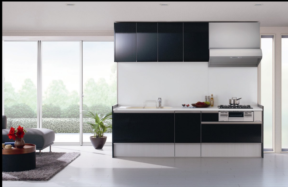
※写真はイメージです。実際の仕様とは異なります。