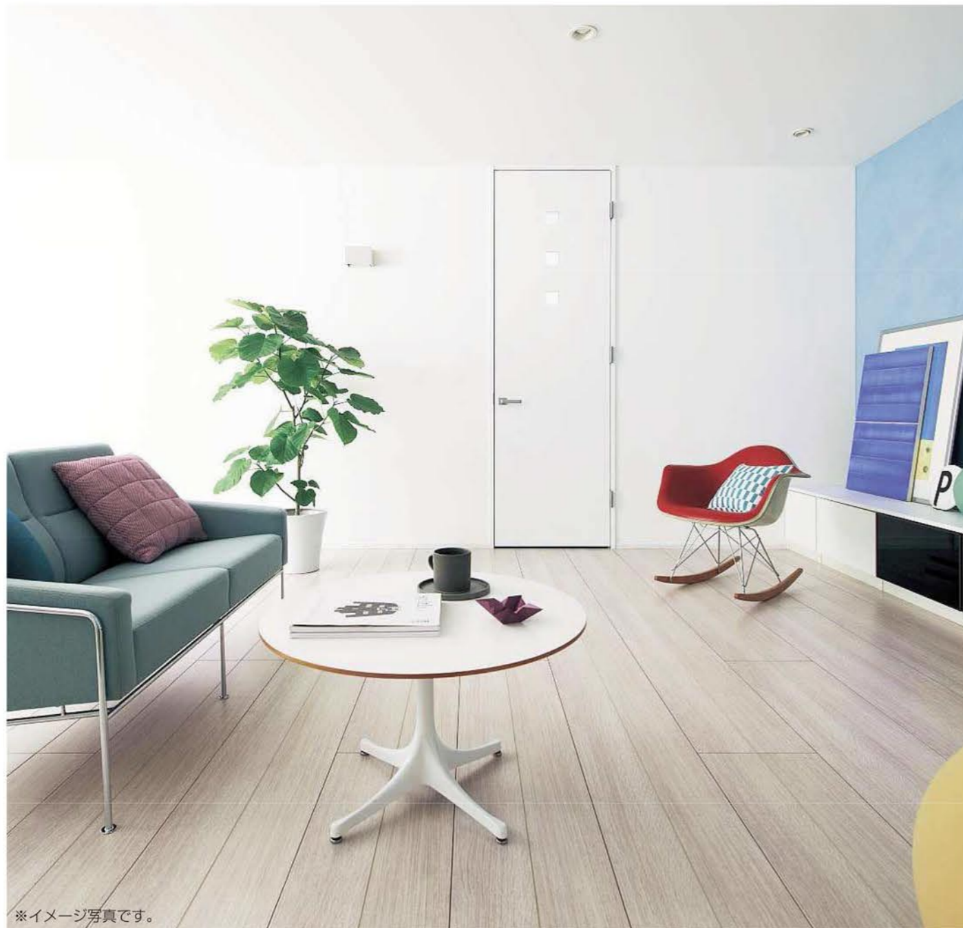
※イメージ写真です。